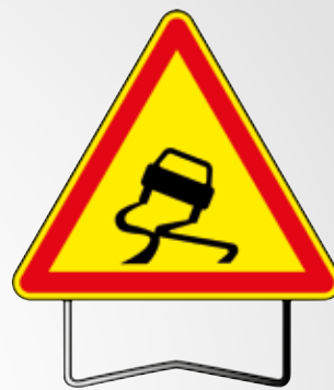
Panneau «chaussée glissante» AK 4-700 TI