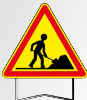
Panneau «travaux» AK 5-700 TI