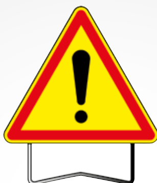
Panneau «danger» AK 14-700 TI