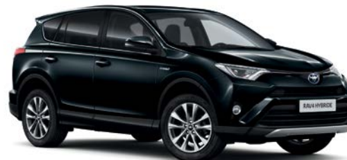
Noir Cobalt métallisé* (221)