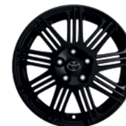
Jante Pitlane 18" alliage noir mat

*Les tailles de jantes et les montes pneumatiques utilisables sont déterminées par l'homologation (se référer à la fiche technique du véhicule). Pour les pneumatiques hiver, une tolérance est appliquée. Pour plus d'informations, veuillez vous rapprocher de votre concessionnaire Toyota.