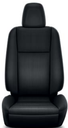
Sellerie tissu noir RAV4 Active.

(1) Sellerie cuir : La partie centrale de l'assise, les faces avant du dossier et de l'appui-tête, ainsi que les faces intérieures des renforts latéraux des sièges et de la banquette arrière sont revêtues de cuir. Les parties latérales, arrière et inférieures des sièges et de la banquette arrière ainsi que les panneaux de portes sont en simili-cuir.