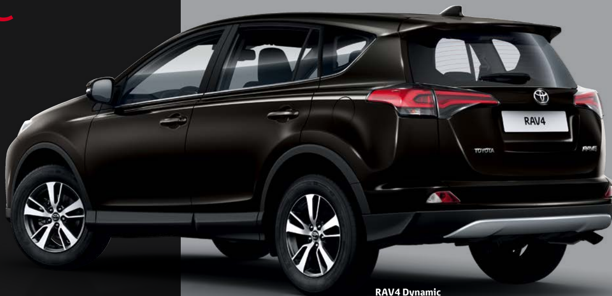
RAV4 Dynamic avec jantes 17" Namus

Le RAV4 Dynamic propose également plusieurs Packs spécifiques qui vous permettront de personnaliser votre véhicule à votre image.