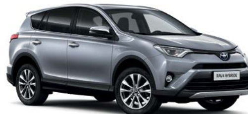
Gris Acier métallisé* (1D6)