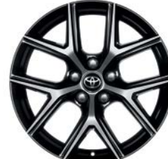
Jante en alliage 18" Tanami RAV4 Design et RAV4 Dynamic - Pack Graphic.