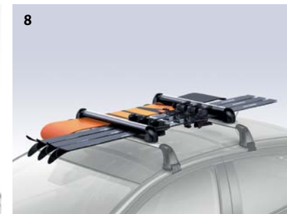
Thule Motion 800 (noir ou argent brillant) 205 cm L x 84 cm l x 45 cm H