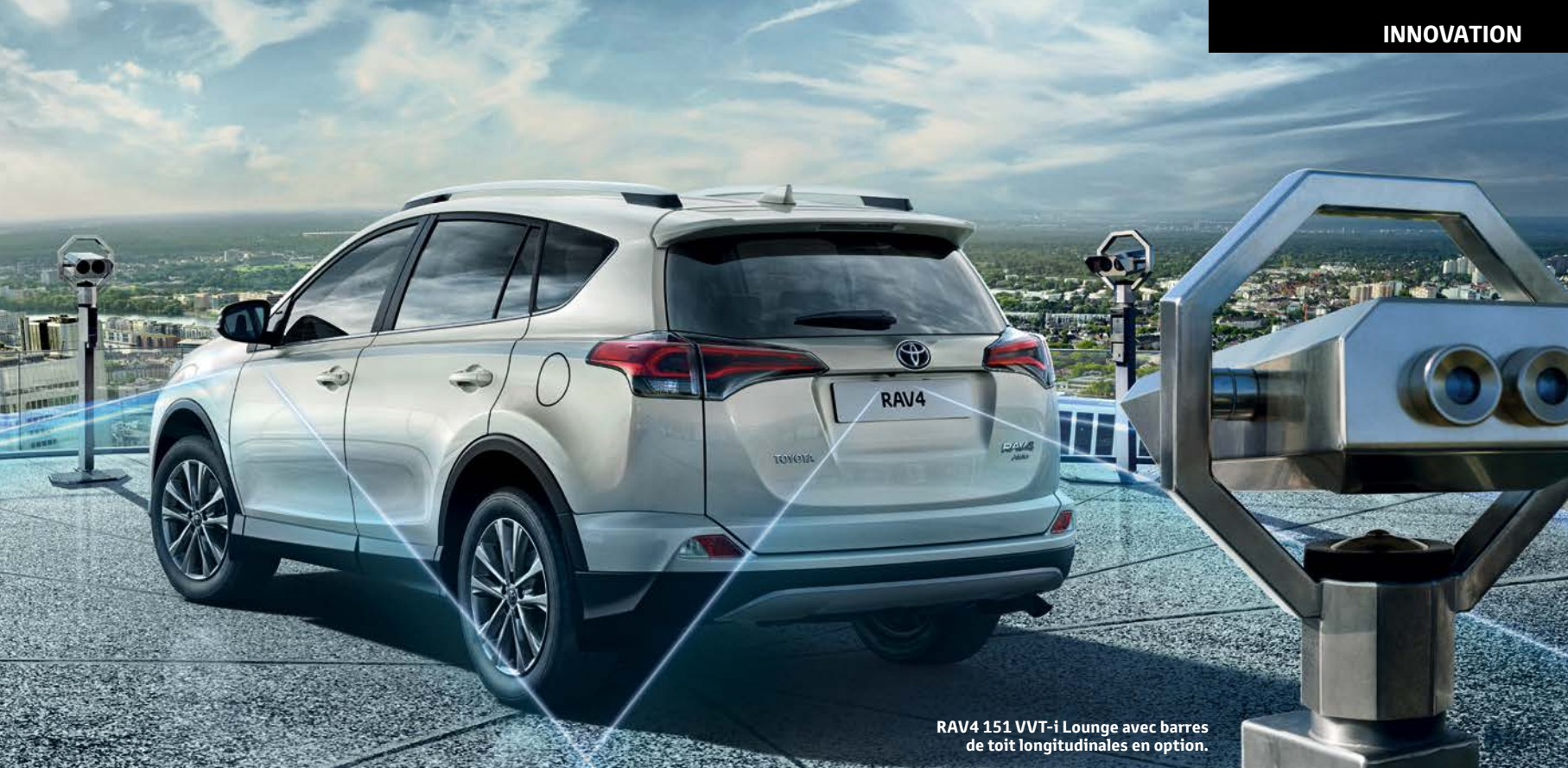
RAV4 151 VVT-i Lounge avec barres de toit longitudinales en option.