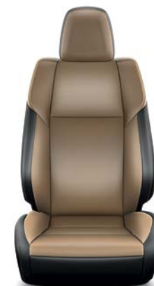
Sellerie cuir beige (1) (Réf. : 40) RAV4 Lounge.