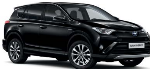
Noir Intense métallisé* (209)