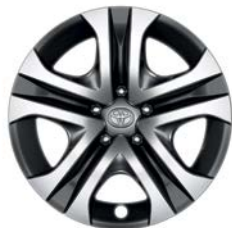
Jante en acier 17" Gobi RAV4 Active.