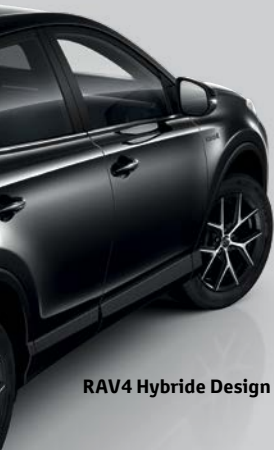
RAV4 Hybride Design