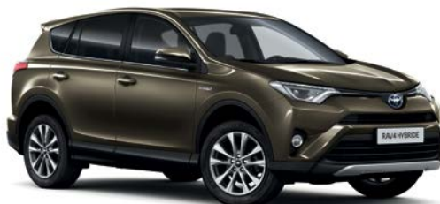
Bronze Clarissimo métallisé* (4T3)