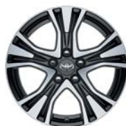
Jante Poseïdon 17" alliage anthracite poli