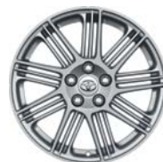
Jante Pitlane 18" alliage argenté