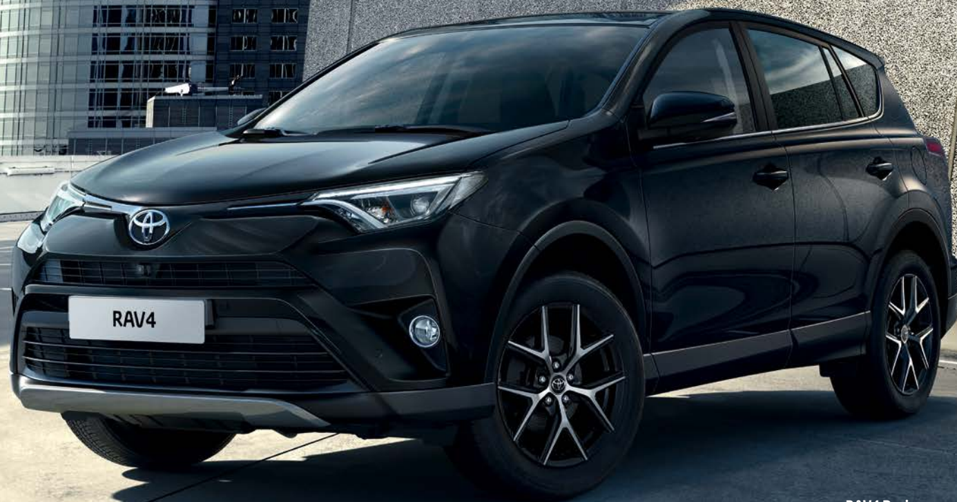
RAV4 Design avec système de vision 360° en option.