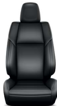
Sellerie cuir noir (1) (Réf. : 20) RAV4 Lounge.