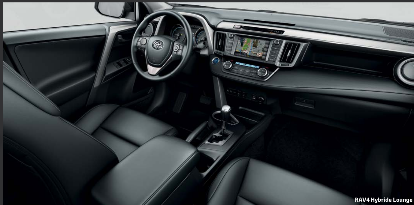
RAV4 Hybride Lounge