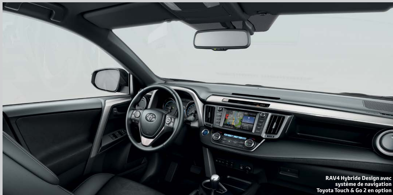
RAV4 Hybride Design avec système de navigation Toyota Touch &amp; Go 2 en option