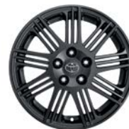
Jante Pitlane 18" alliage anthracite