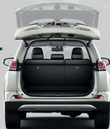
RAV4 Hybride Lounge avec système de navigation 3D Toyota Touch & Go Plus 2 de série.

Système de hayon à ouverture et fermeture électrique actionnable au pied (selon version).