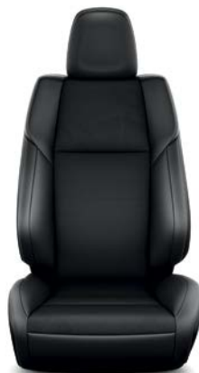
Sellerie tissu, cuir et Alcantara® Design RAV4 Design.