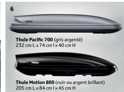
Thule Pacific 700 (gris argenté) 232 cm L x 74 cm l x 40 cm H