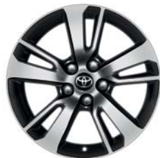
Jante en alliage 17" Namus RAV4 Dynamic Conventionnel.