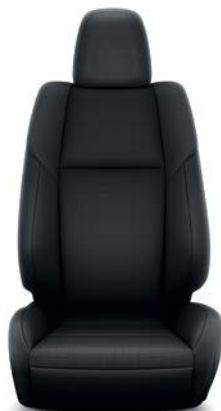
Sellerie tissu Sport RAV4 Dynamic.