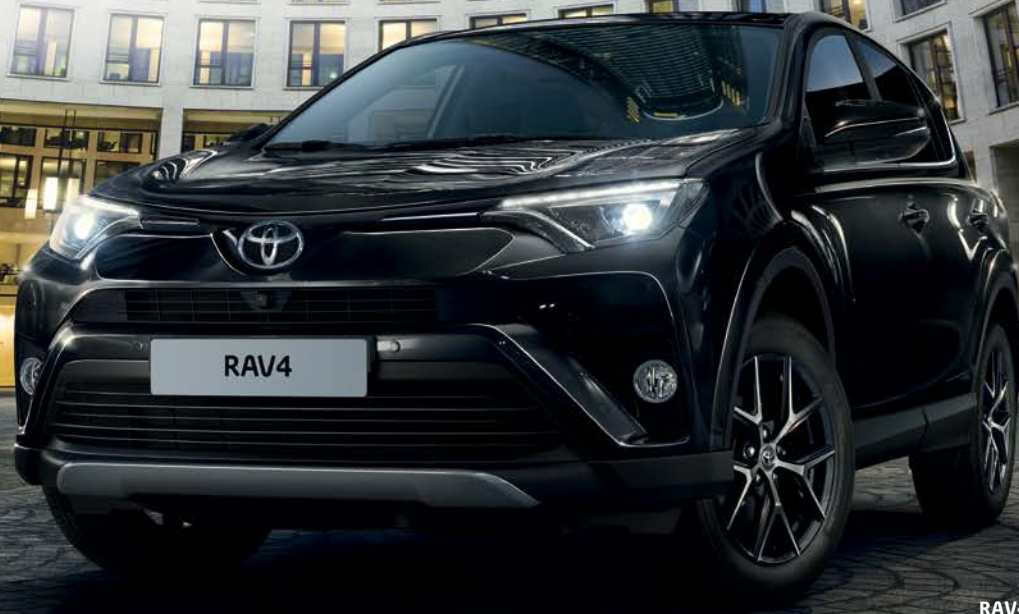
RAV4 Design avec système de vision 360° en option.

Avec le moteur essence 151 VVT-i, en boîte manuelle 6 vitesses ou Multidrive S CVT, profitez des larges possibilités d'un 4 x 4 polyvalent à toute épreuve.