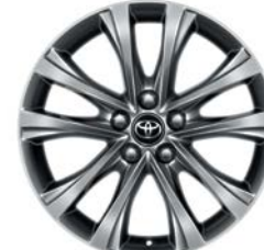
Jante en alliage 18" Sonora RAV4 Lounge.