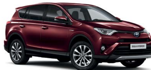
Rouge Pourpre métallisé* (3T0)