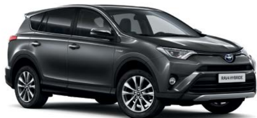
Gris Atlas métallisé* (1G3)