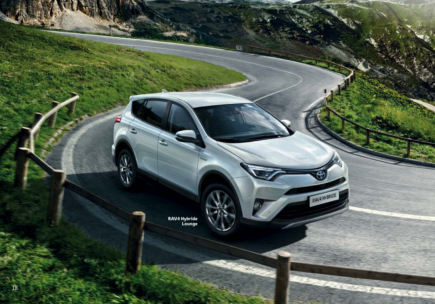
RAV4 Hybride Lounge