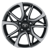
Jante - 5 double branches 17" alliage noir usiné