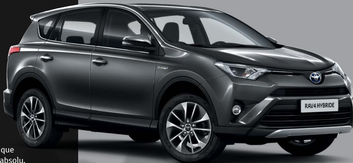
RAV4 Hybride Tendance avec jantes 17" Mojave

Avec le RAV4 Hybride Tendance, découvrez un véhicule doté d'un niveau de confort supplémentaire : l'élégance du tableau de bord gainé de cuir noir, les innovations technologiques pratiques comme le système d'ouverture/fermeture et démarrage sans clé "Smart Entry & Start", les rétroviseurs extérieurs rabattables électriquement, sans compter la climatisation à régulation automatique bizona. Voyagez sereinement dans un confort absolu.