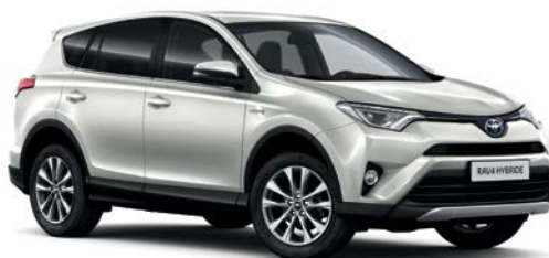
Blanc Nacré* (070)