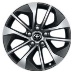
Jante en alliage 17" Mojave RAV4 Hybride Tendance et RAV4 Hybride Dynamic.