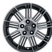
Jante Pitlane 18" alliage anthracite poli