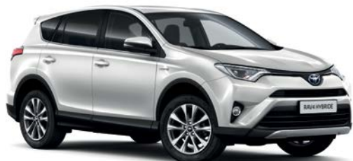
Blanc Pur (040)

Choisissez la couleur qui correspond le mieux à votre personnalité.