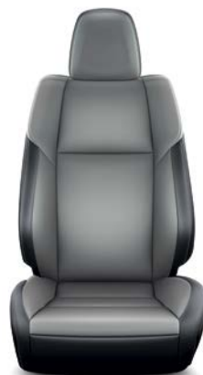
Sellerie cuir gris (1) (Réf. : 10) RAV4 Lounge.