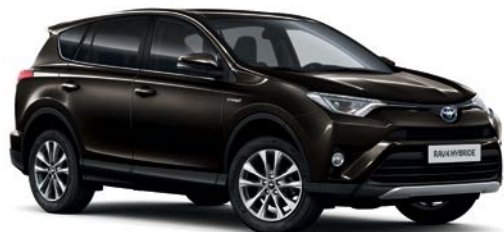
Brun Havane métallisé* (4U5)