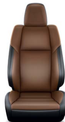
Sellerie cuir havane (1) (Réf. : 30) RAV4 Lounge.