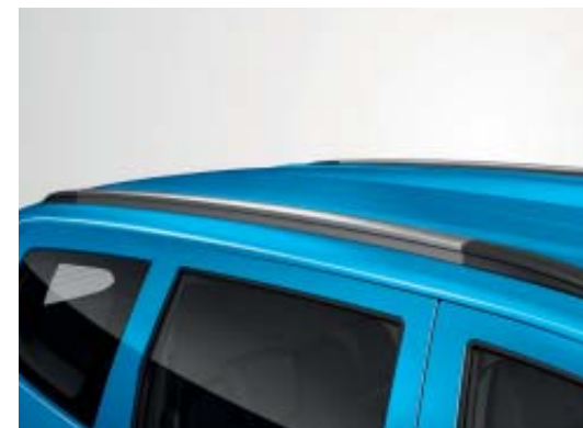
Barres de toit Dark Metal