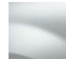
BLANC GLACIER (389)