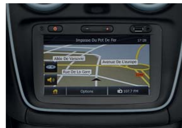
Système multimédia et de navigation MEDIA NAV*