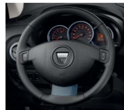
Régulateur et limiteur de vitesse