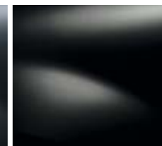
NOIR NACRÉ (676)