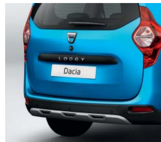
pare-choc avec ski de protection