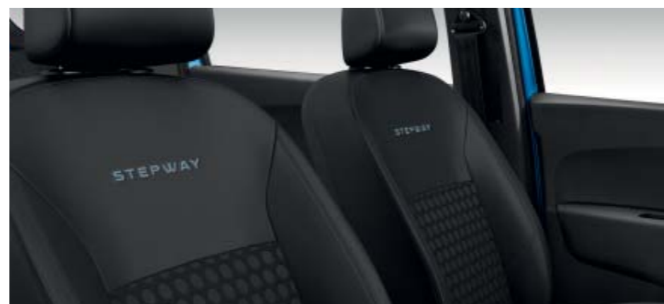
Sellerie spécifique Stepway