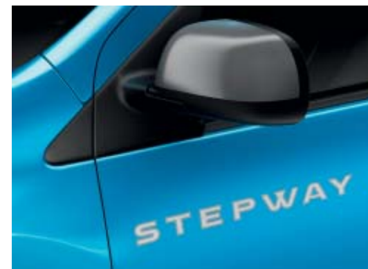
Coque de rétroviseur Dark Metal et striping Stepway