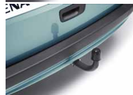
ATTELAGE COL DE CYGNE