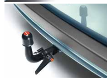
ATTELAGE AVEC ROTULE DÉMONTABLE SANS OUTIL