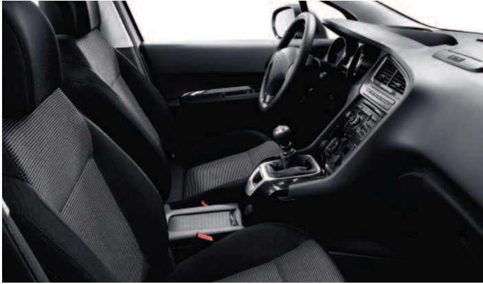
Tissu Strada Noir Tramontane