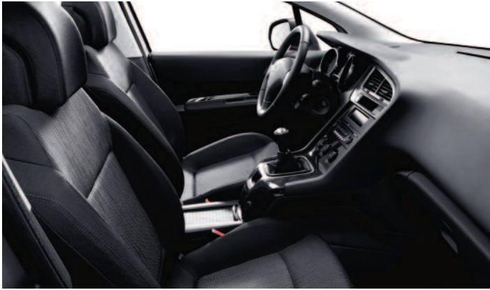
Tissu Ligne Noir Tramontane