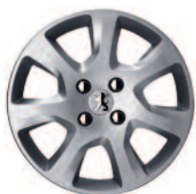
Enjoliveur 16" HAUMEA