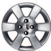
Jante 16" ERIS