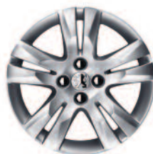
Jante 17" QUARK