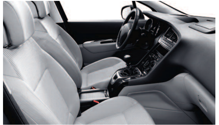
Tissu Strada Guérande