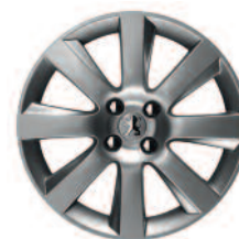
Jante 18" MAGNETIK