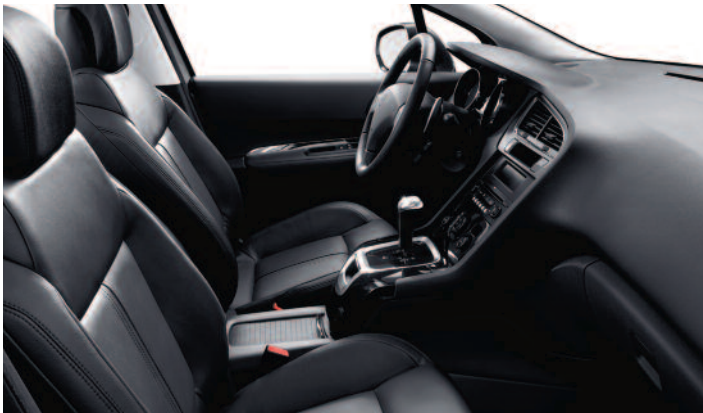
Cuir Noir Tramontane* (en option)

*Sièges en cuir et autres matériaux. Pour le détail, consulter le tarif.