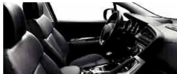
Cuir intégral Tramontane*