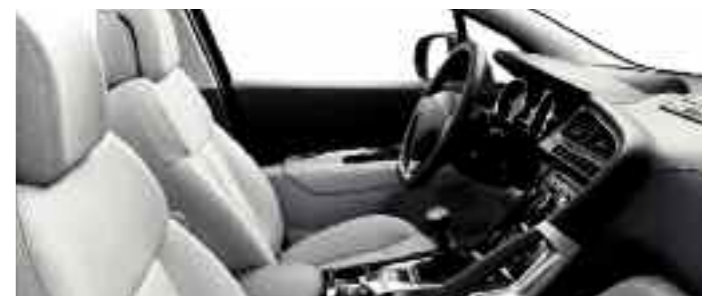
Cuir intégral Guérande*